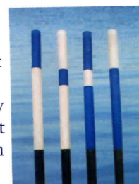
Finska pinnar får alla med lokalkännedom sätta ut.

Väl hemma igen tog jag först kontakt med försäkringsbolaget. Därefter skrev jag till sjöfartsverket med uppmaning om att märka ut grundet med ett kryss i sjökortet och ett sjömärke. Att lägga till ett kryss i sjökortet var inga problem. Värre var det med sjömärket. Det fanns det inte resurser till. Istället hänvisade Sjöfartsverket till en lösning via Transportstyrelsen. Det kostar 5 000 kronor per år att sponsra ett sjömärke privat.