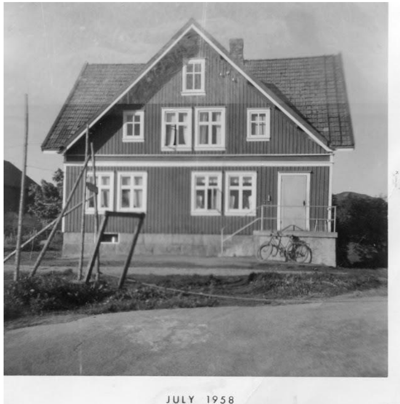
Bröderna Hilmersson föräldrahem på Kämperöd.